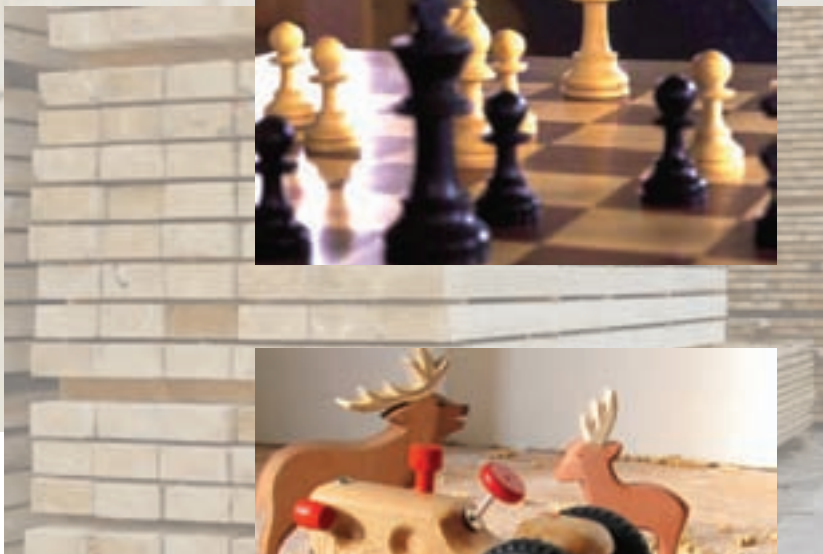
Fotohinweise: Holzfenster, HAF. Schachfiguren, HAF. Fichtenbretter, HAF. Holzspielzeug, HAF. Hintergrund Seite 2 und 3: Nadelstmittholz, HAF.