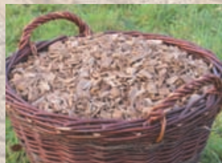
Fotohinweise: Wald, HAF. Grafik Holznutzung, HAF. Expodach, HAF. Hackschnitzel im Weidenkorb, HAF.

Wood is a basic material and an aesthetic element in construction, architecture and furniture design. Wood fibre is the basic raw material for paper production. Wood is energy and a contribution to a stable climate. The utilization of wood in energy-generation is possible as well as one of the above mentioned uses.