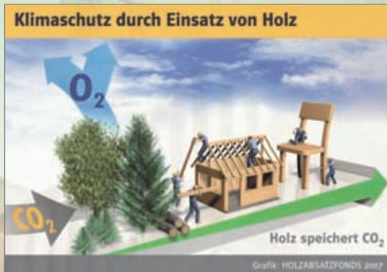
Fotohinweise: Grafik Klimaschutz, HAF. Nadelholz-treppe, HAF. Holzrahmenbau in Dipperz, Hasenhof, HAF. Lärchenlamellen, P&C in Köln, HAF.

The „Forest based Cluster“ in Germany comprises mostly medium-sized companies and maintains the livelihood of many inhabitants especially in the rural areas of the country.